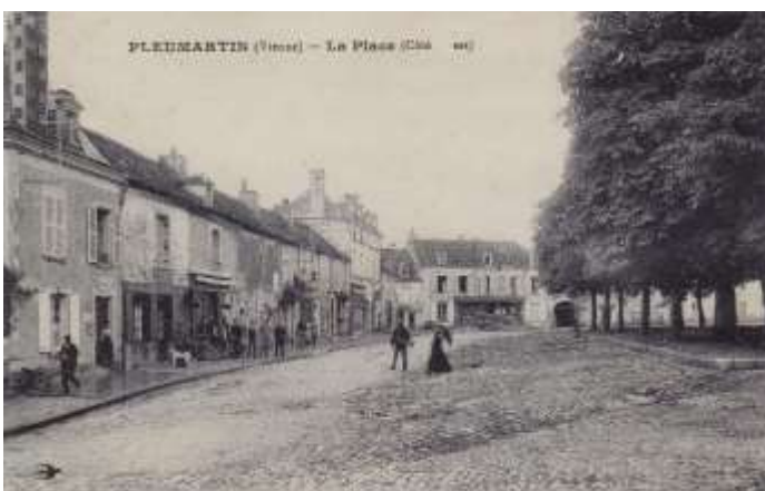
Au début du XXème siècle, la place côté Est avec ses commerces : le bureau de poste, le café Grégoire, le coiffeur Magnon, une grange (actuellement charcuterie Terrasson), la boulangerie Page (puis Cimbaut), la chapellerie Merlaud, le café des Halles qui faisait aussi commerce de cycles-autos, le tailleur Compagnon, le café Guillonnet (dans le coin) puis les tissus Degenne Rouzeau.