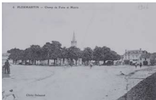
En 1906, la place et le champ de foire au fond duquel on aperçoit l'ancienne mairie avec le palais de justice.