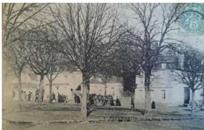
La place côté nord : on aperçoit un cortège de mariage. Au fond, l'hôtel Coutant et l'entrée du château.