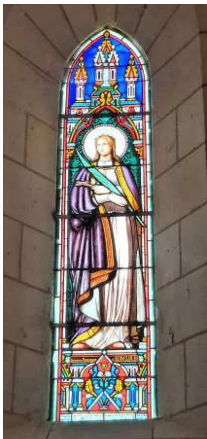
Vitrail Sainte Aurélie à Crémille

La verrière de Sainte Aurélie est située dans l'église Saint-Pierre-ès-Liens du hameau de Crémille à Pleumartin.