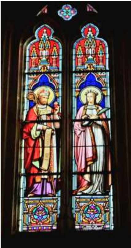
Vitrail Sainte Aurélie à Chaveignes (37)