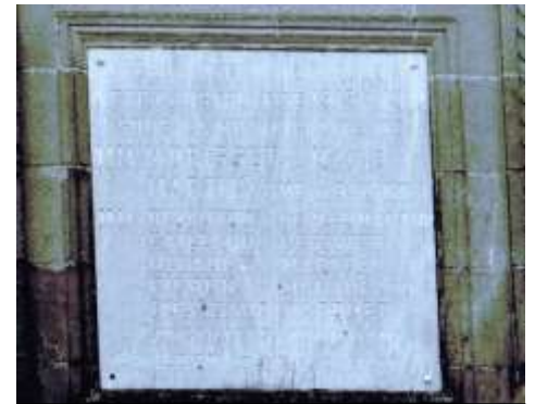
La plaque de marbre sur le fronton de l'hôtel de ville

Cet hôtel de ville fut achevé vers 1920, sur les dessins de l'architecte Ferdinand Milord (né en en 1864 à Angles-sur-l'Anglin). Il fut également l'architecte du monument aux morts de Pleumartin ainsi que de « la villa des Iles » à Vicq-sur-Gartempe.