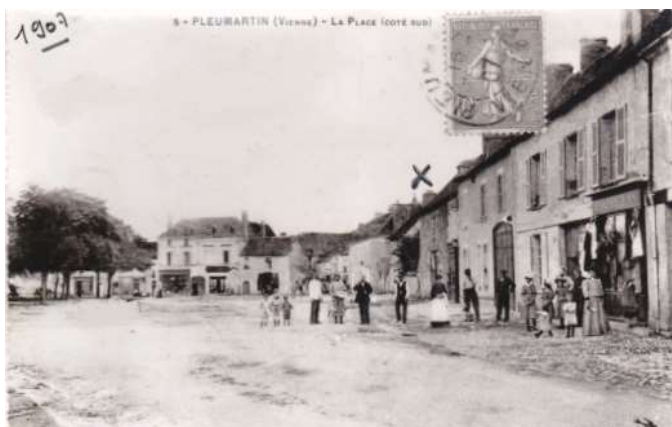
En 1907, l'emplacement de la grange de la famille Millasseau marqué par la croix

Ainsi, en remerciement des dons, cette rue fut nommée Avenue Jourde.