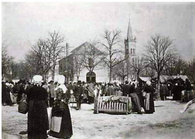
Maison commune jadis sur la place

Autrefois appelée maison commune, la mairie, ou plus noblement hôtel de ville, constitue depuis la Révolution française le théâtre essentiel de la vie administrative. Depuis la Révolution française, la commune est administrée par un conseil municipal.