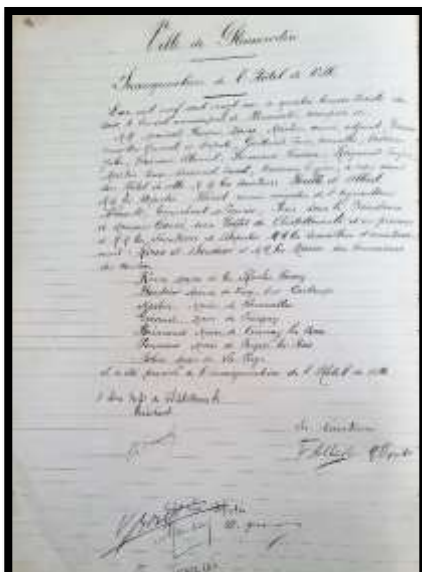
Délibération du 10 juillet 1921

On peut remarquer que la façade est directement inspirée du style Beaux-Arts mis à la mode à cette époque par l'Opéra Garnier ou la gare d'Orsay à Paris.