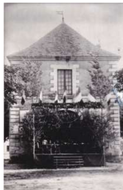
Façade de l'ancienne mairie nord-est

Face à ces transformations, il fut décidé de construire une nouvelle mairie.