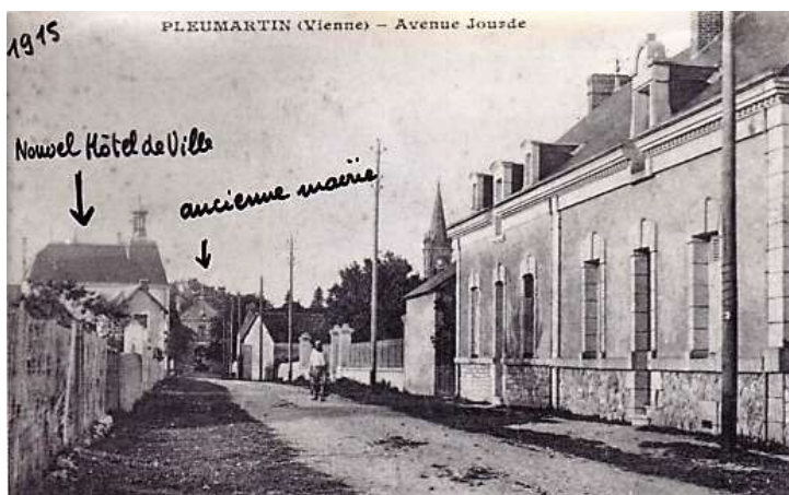
L'avenue Jourde avec au fond, sur la place, l'ancienne mairie et à gauche l'hôtel de ville juste construit

Pour construire cette nouvelle mairie, les pierres furent acheminées par voie ferrée. Elles provenaient principalement de l'entreprise « Civet Pommier » exploitant la carrière Château Gaillard de Migné-Auxances. Elles étaient débitées et taillées sur place. Ces pierres calcaires, d'un aspect légèrement crayeux, sur fond blanc grisâtre, étaient extraites d'une roche sédimentaire datant du Jurassique, durant l'ère secondaire (-200 millions d'années).